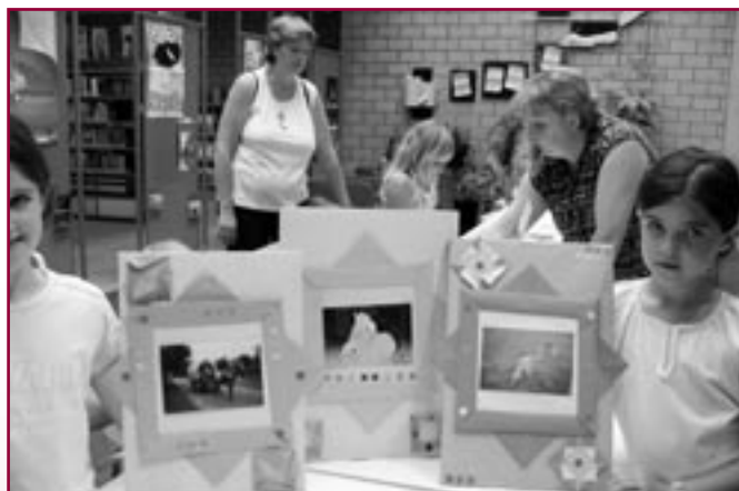
Een knutselnamiddag tijdens zomervakantie 2006

Openingsuren: maandag: 14.00 tot 17.00 u. woensdag: 13.30 tot 18.00 u. donderdag: 17.30 tot 20.00 u. zaterdag: 10.00 tot 12.00 u.