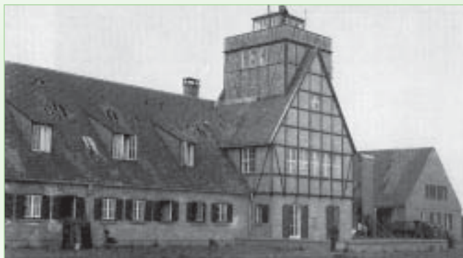
De oude luchthaven