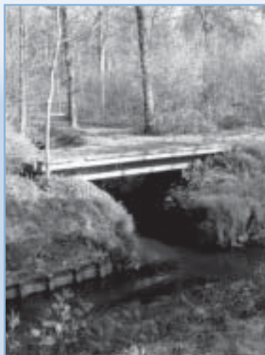
De Barebeek krijgt haar naam vanaf de samenvloeiing van de Lellebeek/Leibeek en de Molenbeek in Perk

principe: wie een speciaal belang heeft bij de werking van de watering, moet in de kosten van de werking bijdragen en is vertegenwoordigd in het bestuur.