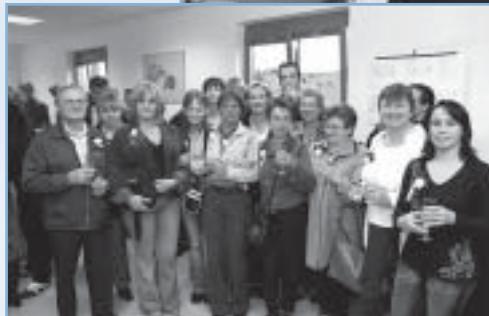
OCMW-medewerkers van de poetsdienst, dienst gezinszorg, klusjesdienst, dienst warme maaltijden, serviceflats De Zilveren Esdoorn