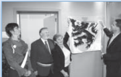
Officiële inhuldiging van het Sociaal Huis-OCMW