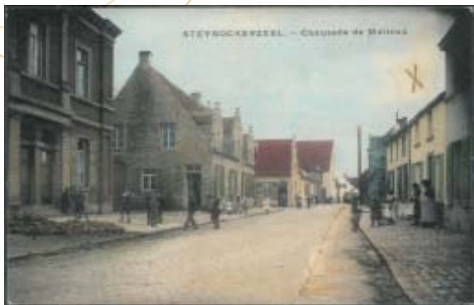
Steynockerzeel: oud gemeentehuis