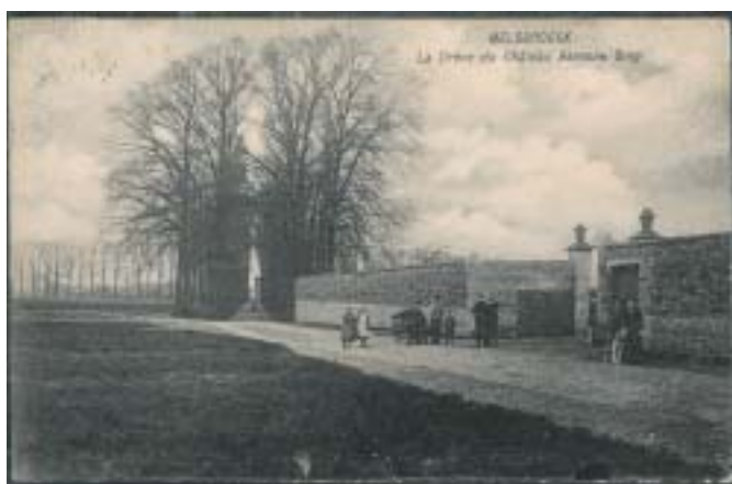
Melsbroek: Hof van Sellaer Ingang langs de dreef Nu: Hoolantsstraat en Nachtegaalslaan