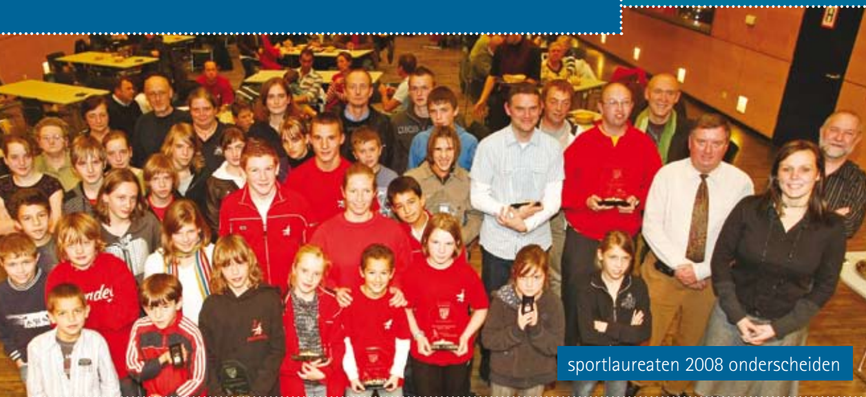
sportlaureaten 2008 onderscheiden