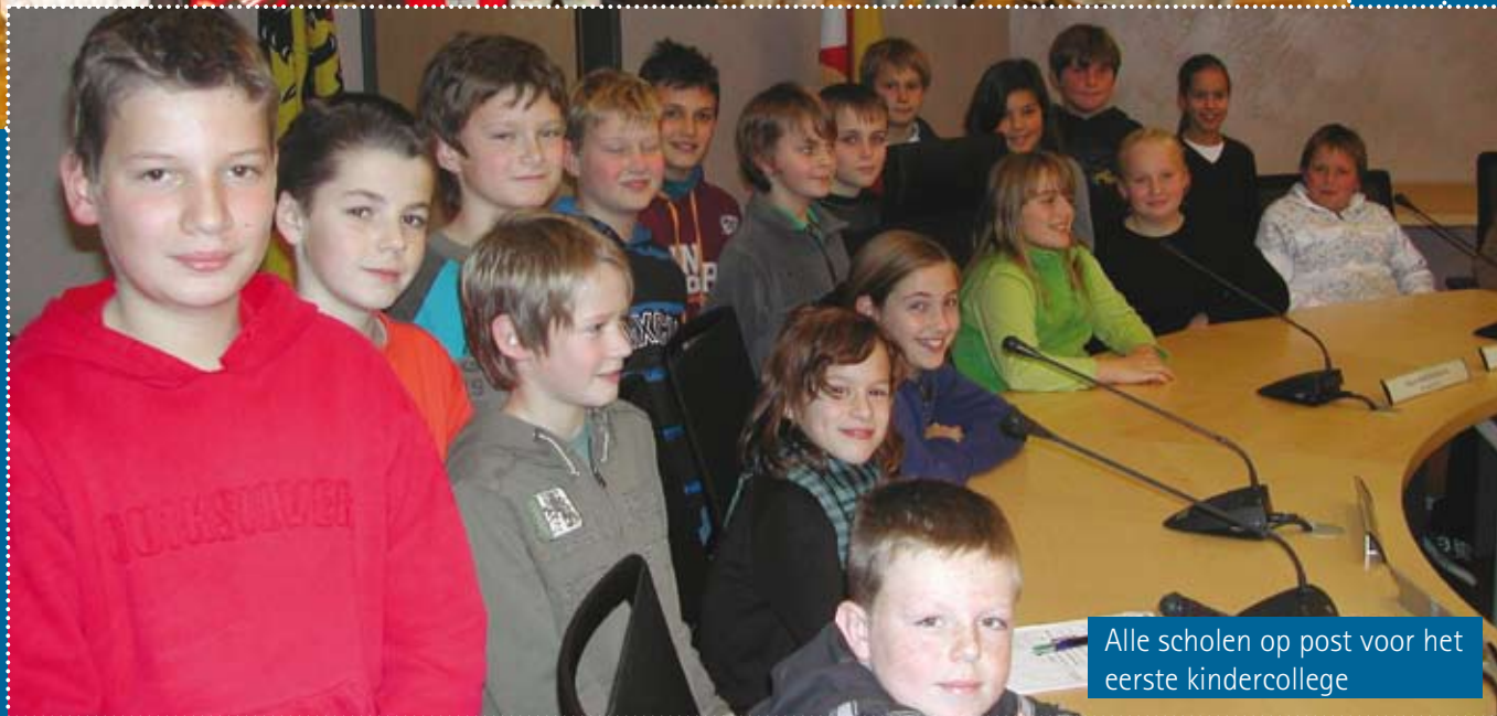
Alle scholen op post voor het eerste kindercollege