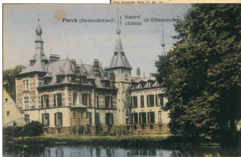
Kasteel te Perk