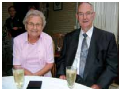
Echtgenoten Vandesande - Beullens