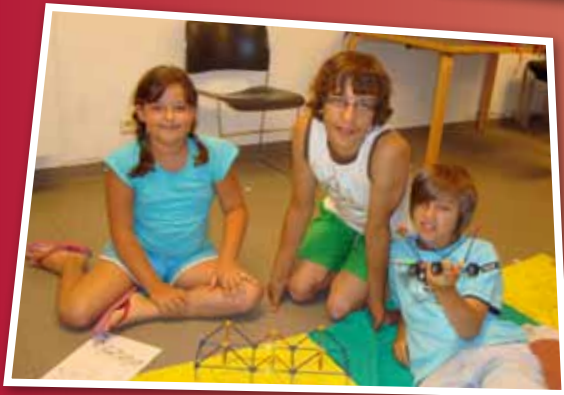
Grabbelpas - Knextergek