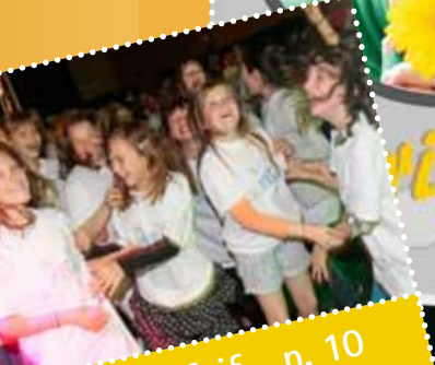
Mega-fuif p. 10