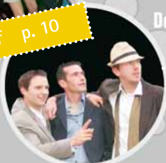
De 3 Tenoren (Ambiancegroep)