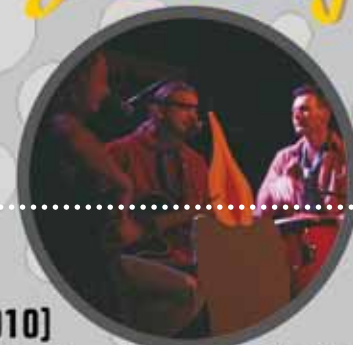
De Boegiekes (freepodium 2010) (Comeback van het jaar)