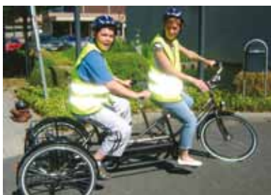
Zin in een ritje?

Voor meer inlichtingen i.v.m. het uitleenreglement ( www.steenokkerzeel.be/reglementen ) en reservatie kan je contact opnemen met de cultuurdienst tel: 02 254 19 76 of mailen naar cultuurdienst@steenokkerzeel.be .