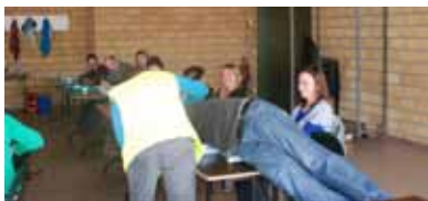
Simulatie "opening van een onthaalcentrum" – waar mensen terecht kunnen in het kader van een noodsituatie – één van de fases in het kader van een noodplanning.