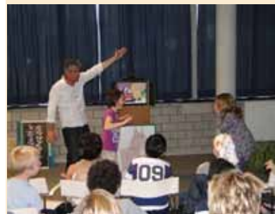
Hikke-takke-toe aan de slag met leerlingen van het derde leerjaar aan een 'geheim project'

Vergeet ook onze collectie DVD's niet! We hebben reeds meer dan 2100 films in onze collectie. Er is een ruim aanbod, zodat iedereen zijn gading vindt. Leuke kinderfilms, romantische komedies, thrillers, historische drama's, familie-films, documentaires...Kom eens kijken,