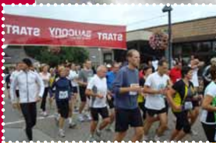
7 e Stratenloop 1 oktober 2011