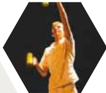
› De Stekskes

De frontman van The Scabs brengt een concert in de intieme setting van een tapijtconcert met zijn kussens, tapijten en feerieke verlichting en lekkere hapjes. In het voorprogramma staat lokaal talent dat werd ontdekt tijdens het Steenokkerzeels freepodium van 2010.