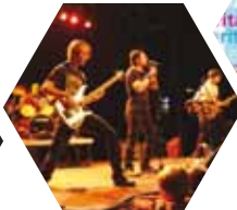
› No Foreplay