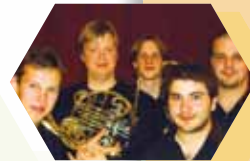
› Fortuna Brass

Zondag 02/10 om 14.30 u. (VVK € 8 - KA €10)