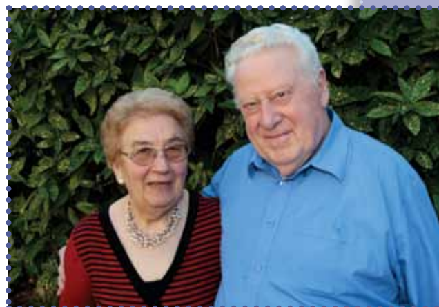
Echtgenoten Vancraeynest - Blockmans