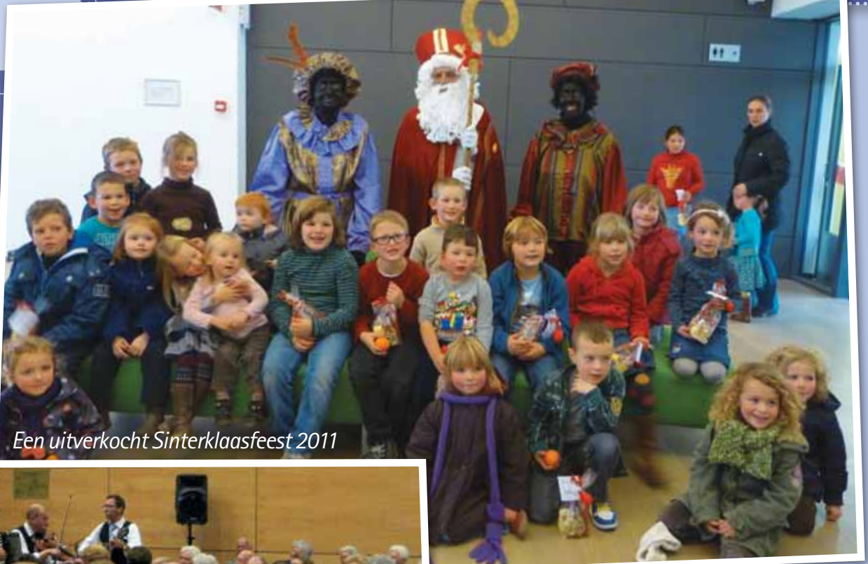
Een uitverkocht Sinterklaasfeest 2011