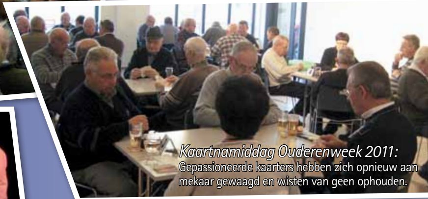
Kaartnamiddag Ouderenweek 2011: Gepassioneerde kaartspelers hebben zich opnieuw aan mekaar gewaagd en wisten van geen ophouden.