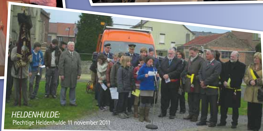
HELDENHULDE: Plechtige Heldenhulde 11 november 2011

Succesvolle kindervoorstelling De Koele Kapper i.s.m. de lokale gezinsbonden