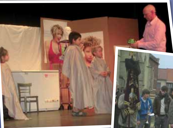
De Koele Kapper

Succesvolle kindervoorstelling De Koele Kapper i.s.m. de lokale gezinsbonden