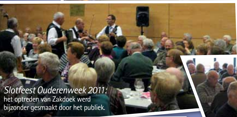
Slotfeest Ouderenweek 2011: het optreden van Zakdoek werd bijzonder gesmaakt door het publiek.